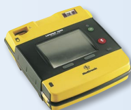
AED Lifepak 1000